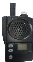
列車見張員 支援装置