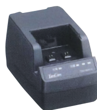
高容量 電池充電器