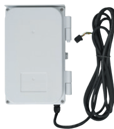
警報音センサ端末 W148×H219×D50mm