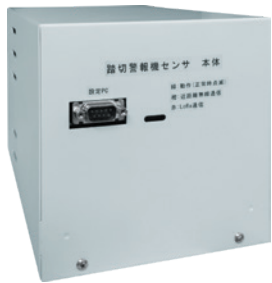
本体 W147×H147×D200mm (信号用リレーC形相当)