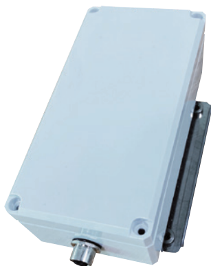
W80×H160×D56mm (モジュール増設の場合変更有)