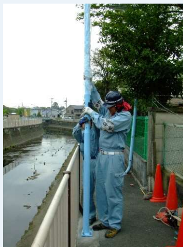
②分割タイプ上柱をジョイント