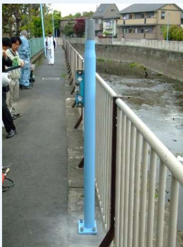
①分割タイプ下柱を設置